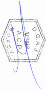
Vladimir Sánchez Escobar Ministro Min. Obras Públicas, Servicios y Vivienda